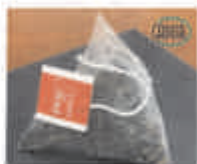
Линия фасовки чаёв