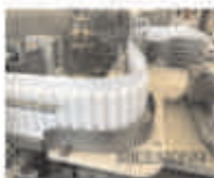
Линия фасовки мондозы