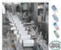
Картонные упаковочные машины