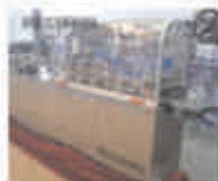
Машины двусторонней упаковки